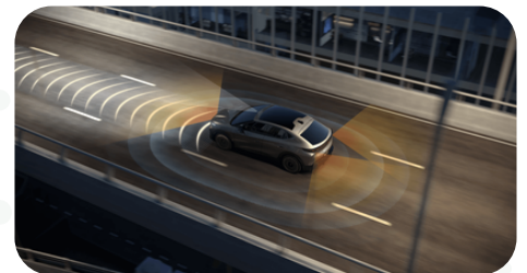
Cámara 360 y asistencia en ruta