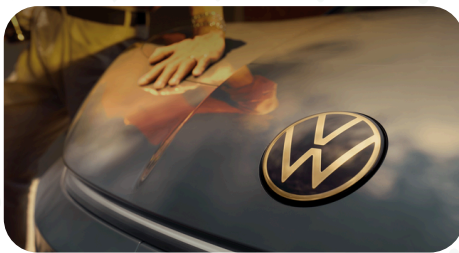
Estética elegante interna y externa