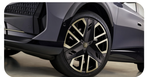
Neumáticos y aros aerodinámicos