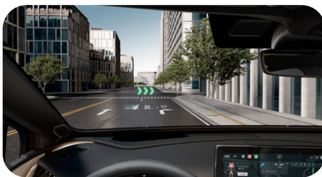
Cuadro de instrumentos de 5,3"