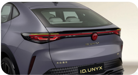
Parte trasera moderna