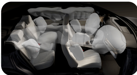
Airbags frontales, laterales y traseros