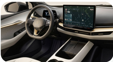
Cabina premium y tecnológica