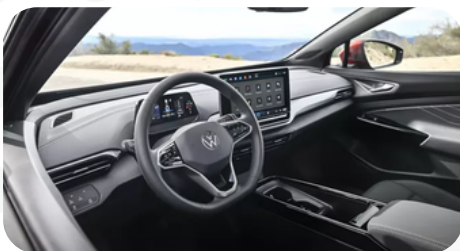
Cabina premium y tecnológica