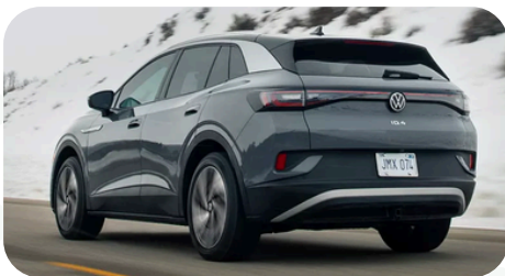
Parte trasera moderna