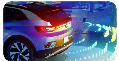
Cámara 360 y asistencia en ruta