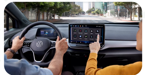
Pantalla de 12 pulgadas