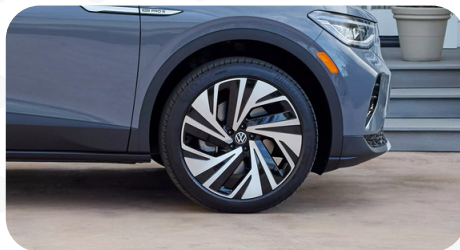
Llantas de aleación de 21 pulgadas