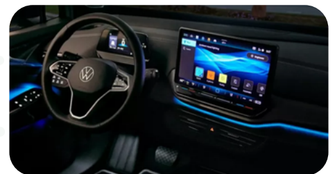
Iluminación ambiental (30 tonos)