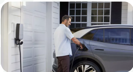
Carga rápida de 100 kW