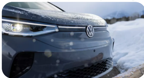
Faros delanteros LED automáticos